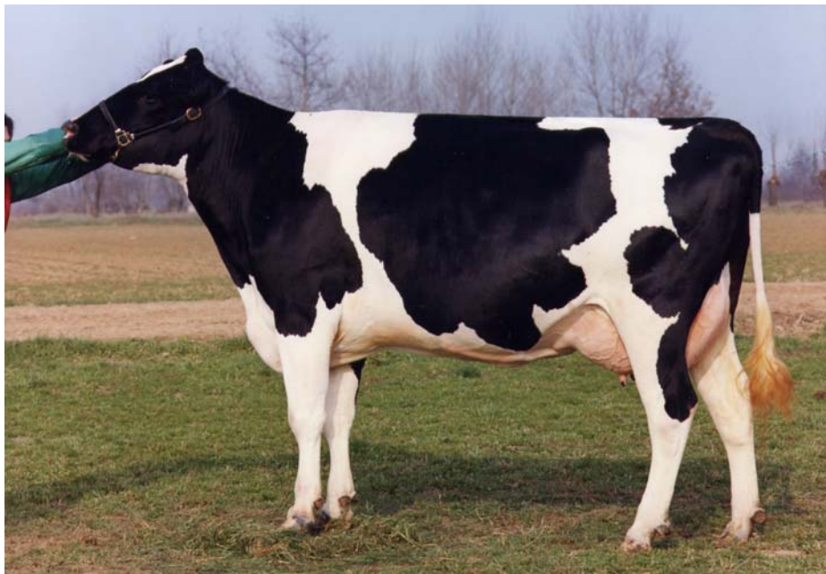
Aquila Cleitus VANESSA - BS 7884 F