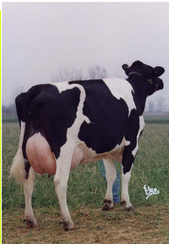
Aquila Cleitus VANESSA - BS 7884 F