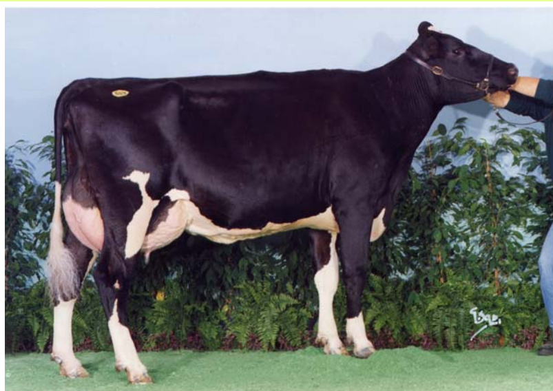
Aquila Mascot DAMA et - BS 4803H

La famiglia di Quebec ha radici profonde che risalgono ad una vacca importata dagli Usa dagli Spinelli di Brescia, New-Hope-View Neil Hilite, valutata VG88. Grazie ad Hilite ed alla sua numerosa progenie, il prefisso "Aquila" è conosciuto da tutti gli appassionati allevatori Holstein. La figlia più famosa di Hilite è stata senza dubbio Aquila Cleitus Vanessa, una stupenda figlia di Cleitus valutata Ex 90. Da Vanessa, usatissima per produrre embrioni, sono nate parecchie figlie tra cui ricordiamo Aquila Blackstar Beta, una strepitosa Blackstar valutata Ex 94. Vanessa è la madre di Aquila Mascot Dama VG86 che fu acquistata dai Cedroni di Orzinuovi, Bs. Dama è stata campionessa di categoria alla Nazionale di Cremona e miglior mammella. Da Dama i Cedroni ottennero numerose figlie, tra cui Cedroni Wells Ingrid B+84, nonna di Quebec e madre di Cedroni Aaron Michela. Michela, molto sfruttata per produrre embrioni, ad oggi ha chiuso due lattazioni, la prima superando i 134 q.li di latte e la seconda i 143 q.li sempre con titoli molto alti. Quebec, è figlio di Best (Wade x Emory x Leadman), ad oggi tra i tori ancora più utilizzati in Italia. Quebec ha una sorella piena valutata Vg85, che ha appena iniziato la seconda lattazione.