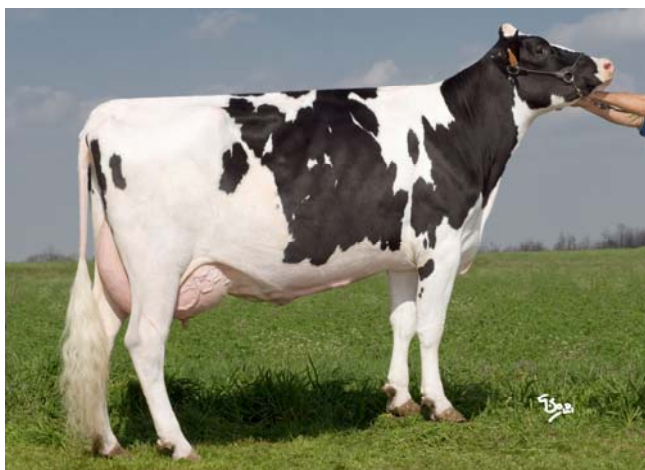
Villa Egoyan 68 - IT019990256358

Egoyan ha un pedigree molto profondo che risale ad una famiglia Usa. Le ultime sei generazioni della famiglia sono almeno VG, dove risalta una delle migliori figlie di Lekker Valiant Royalty statunitensi, Hardys Royalty Tamara, valutata Ex92 a sette anni con mammella Ex. Egoyan è frutto del "Golden Cross" Step x Tugolo. La madre Ape Tugolo Bijou, valutata VG88 con mammella VG attualmente sta chiudendo la quinta lattazione. La nonna è una figlia di Mandel molto produttiva, valutata VG85, la bisnonna una Aerostar VG 88, ha raggiunto in prima lattazione il 4,20% di proteina, segue Tamara, la Royalty Ex92. Egoyan nel suo pedigree ha i migliori "geni" della selezione Holstein.