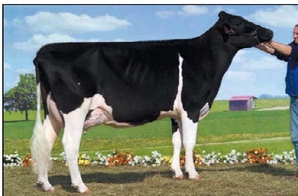
Bell Stormatic IZA - VG 87