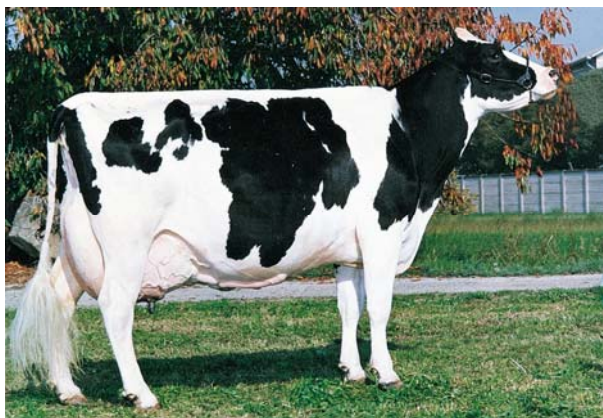
Al-Pe Dynamo Luna Ex-96 – La vacca capostipite della famiglia di Etrusco. Ha almeno 50 discendenti classificate Very Good ed altre 9 Excellent

Ed ora con Etrusco, il grande potenziale genetico di questa famiglia è a vostra disposizione!