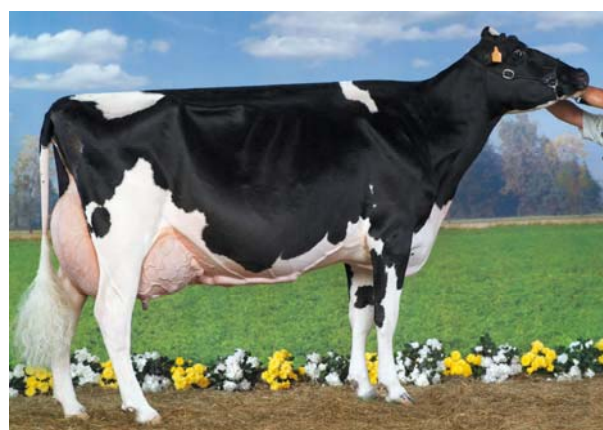
Al-Pe Doriana la campionessa alla Nazionale di Cremona nel 2006 e 2007 proviene dalla stessa famiglia