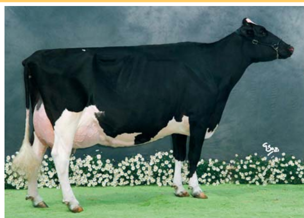
Al-Pe Juror Virgien -Ex 93 nonna di Etrusco