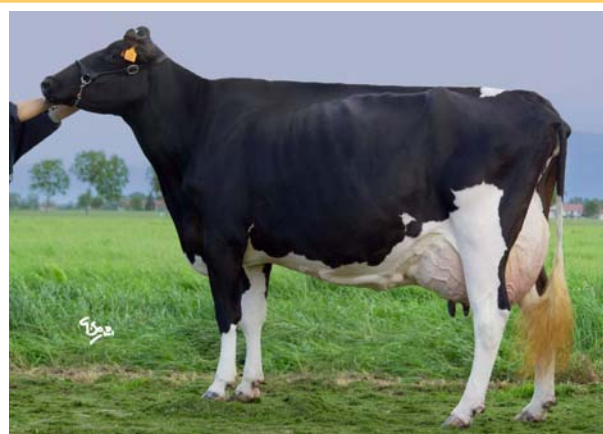
Bel Mtoto Doroty Ex-90, madre di Etrusco