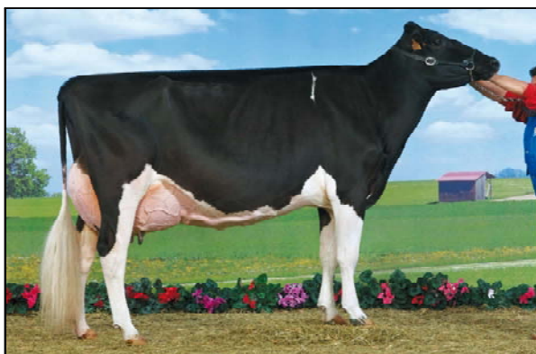
Bel Stormatic IRA VG 88-Campionessa al Dairy Show 2007, Campionessa di Riserva a Oldenburg e Campionessa del Gran Prix 2007