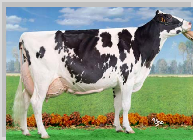
Fusa Capri Sorca – Campionessa Assoluta Vacche