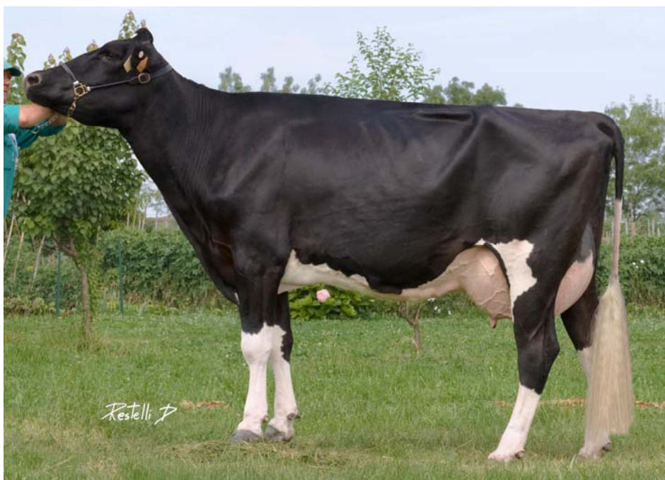
Rinetta Stormatic Lucilla et - madre di Sender