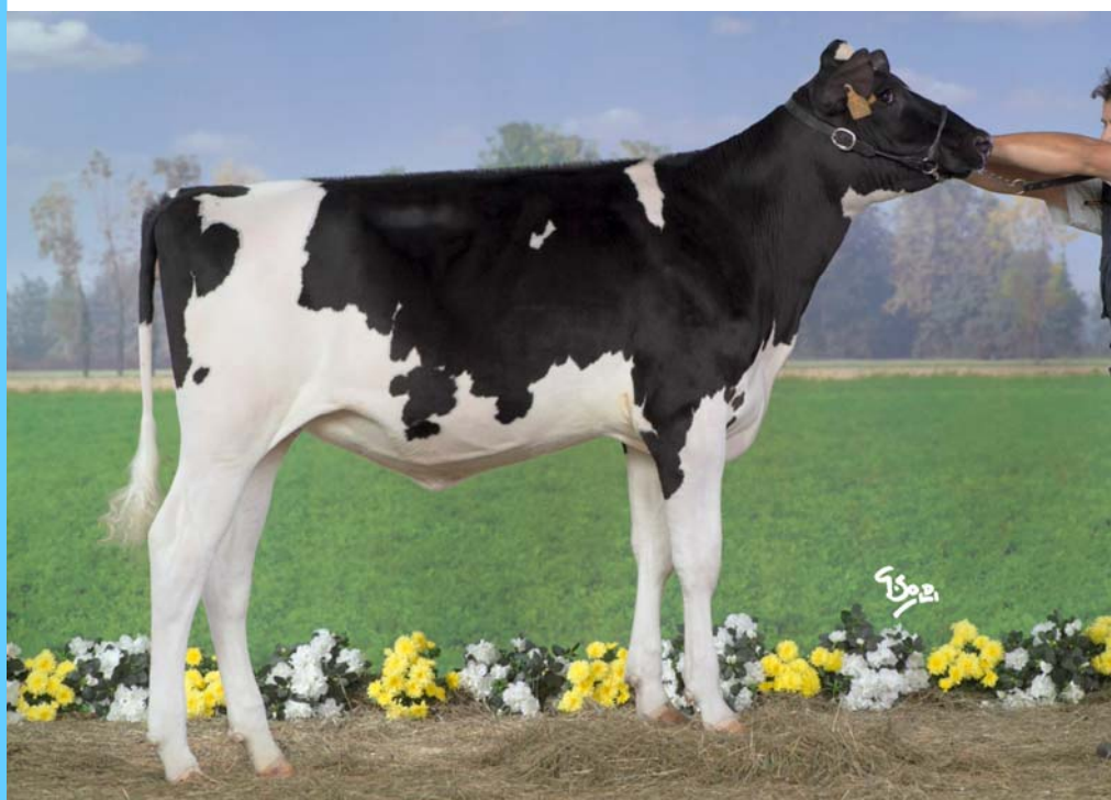
New-Farm Duplex Giada - madre di Sissokò

Colore paillettes BLU KCaseina AA IT019990549209